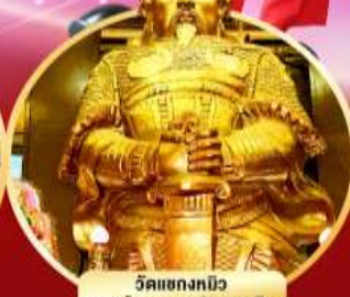
วัดเขกทมิว ขอพรโชคลาภ การเงิน และธุรกิจ