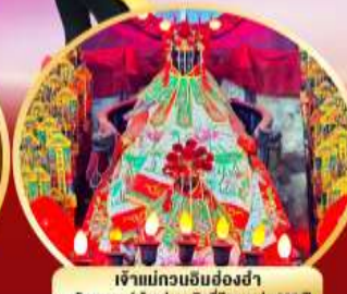
เจ้าแม่กวนอิมฮ่องกง นมัสการองค์เจ้าแม่กวนอิมที่มีอายุกว่า 600 ปี