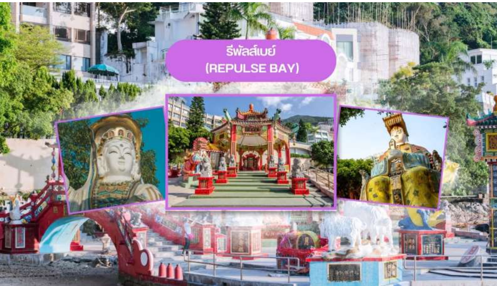
รีพัลส์เบย์ (REPULSE BAY)