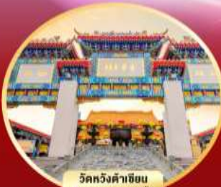
วัดหวังต้าเซียน ขอพรสุขภาพ ความดี