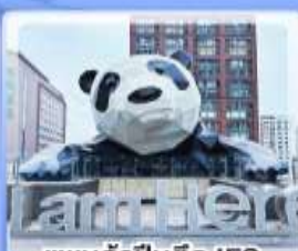
แพนด้าปิ่นตึก IFS