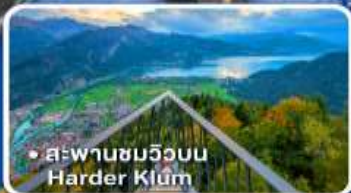
• สะพานชมวิวยิบ Harder Kluem