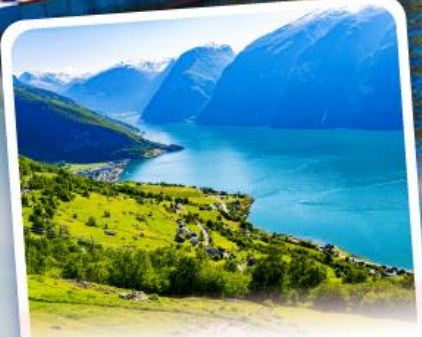
ช่องฟยอร์ด