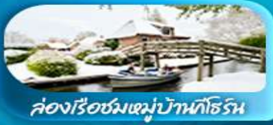
ล่องเรือชมหมู่บ้านทอร์น

เดินทาง 29 ม.ค. - 05 ก.พ. 69 25 ก.พ. - 04 มี.ค. 69 / 28 พ.ค. - 04 มิ.ย. 69