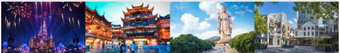
เซียงโฮ้ตีสันยีแลนด์