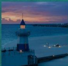
Light House Restaurant